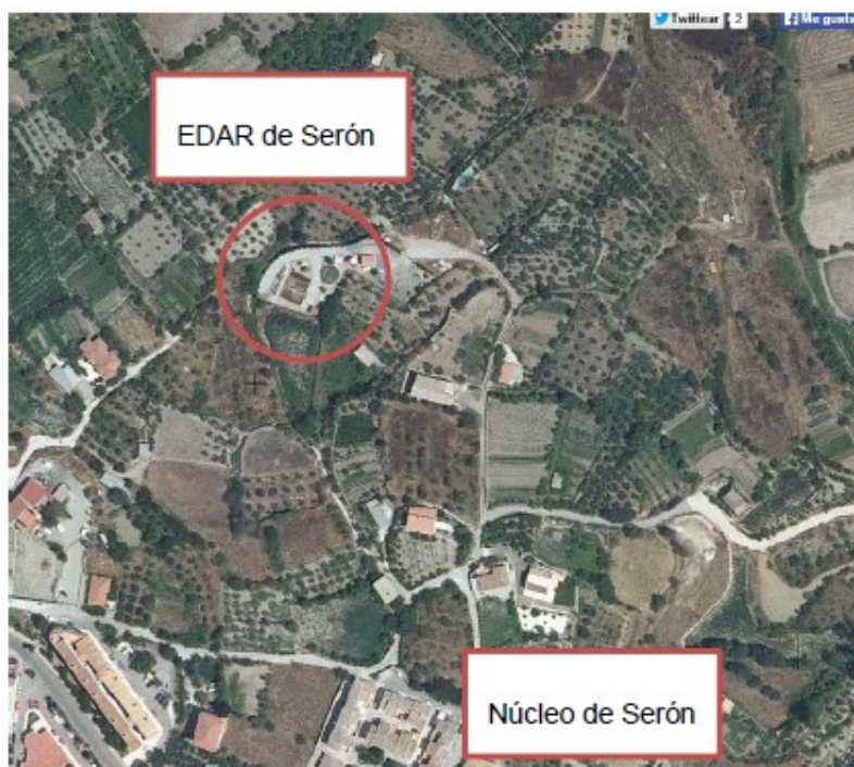
Ilustración 2: EDAR de Serón. Localización

La EDAR de Serón ubicada en la parcela catastral 04083A016002640000FL, ocupa una superficie de 1.497 m 2 , y dista del núcleo 120 metros aproximadamente. El sistema de tratamiento de aguas residuales es un sistema convencional de fangos activados, con una capacidad de 420 m 3 /día y 2.800 habitantes equivalentes. Dispone de una EBAR de aguas residuales, formada por un grupo de dos motobombas de 15 kw de potencia cada una, encargadas de elevar las aguas hasta la EDAR.