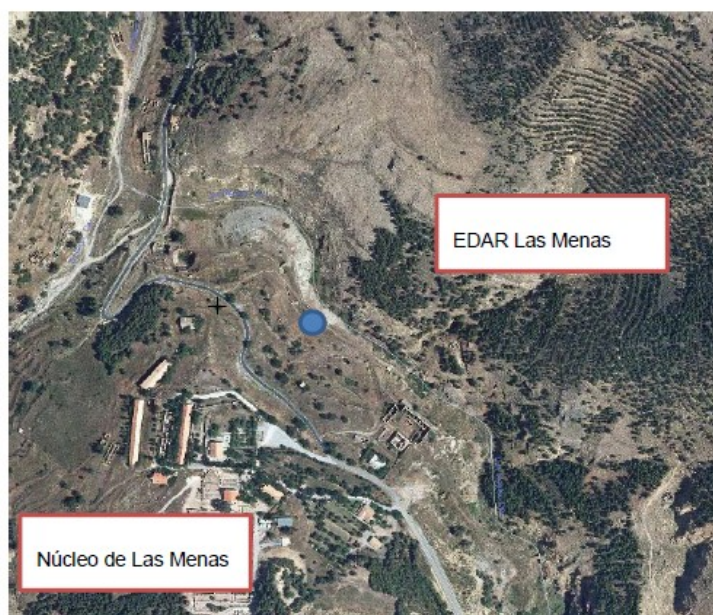
Ilustración 4: EDAR Las Menas. Localización

Se localiza junto al Barranco de las Menas en la parcela catastral 3565201WG4236N.