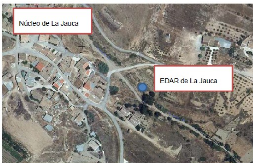
Ilustración 3: EDAR la Jauca. Localización

El sistema de tratamiento de aguas residuales está compuesto por una Decantación-Digestión y un lecho bacteriano para una población equivalente de 100 hab.